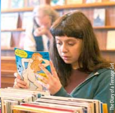
The Diary of a Teenage Girl