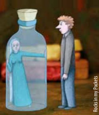
Rocks in my Pockets