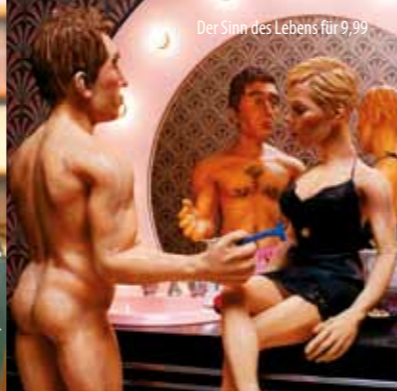
Der Sinn des Lebens für 9,99